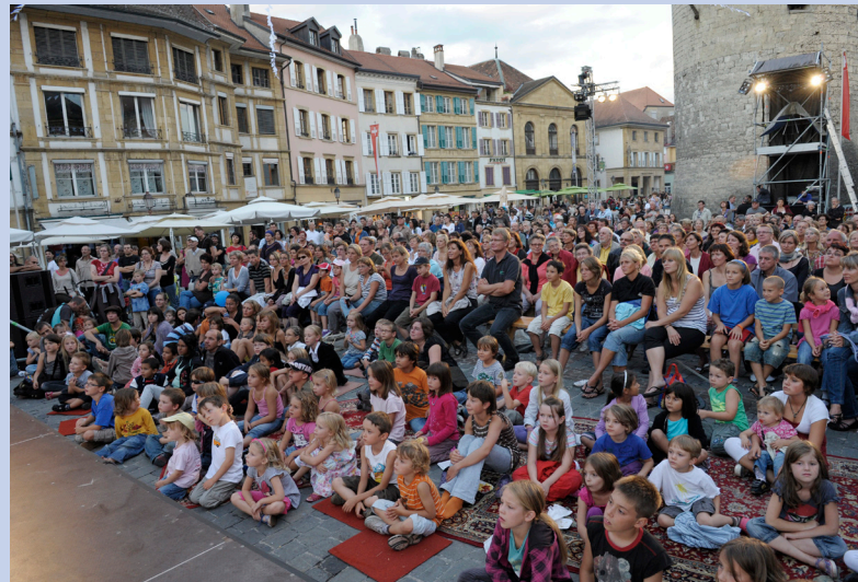
Les Jeux du Castrum sont toujours aussi populaires, chez les grands comme chez les petits! La foule a été nombreuse tout au long des trois jours.