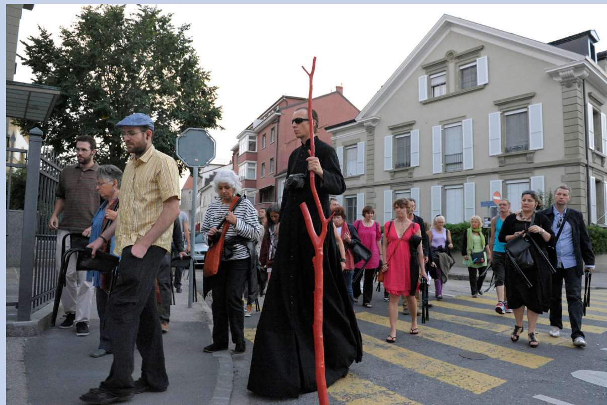
Le théâtre ambulateur est allé à la rencontre de ses adeptes! Les Jeux du Castrum se veulent un lieu d'échanges.